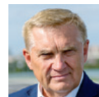
▲ Tadeusz Truskolaski prezydent Białegostoku

Białystok realizuje ponadstandardowe programy edukacyjne, np. kompleksowe programy rozwojowe w ramach Erasmus+ pozwalające podnosić kompetencje uczniów i nauczycieli, jak również atrakcyjność i efektywność kształcenia zawodowego oraz zwiększające kompetencje w zakresie posługiwania się językiem angielskim. Uczniowie mogą uczestniczyć w praktykach i stażach zagranicznych zawodowych dających wsparcie w zdobyciu kompetencji (wiedzy, umiejętności i postaw), polepszające rozwój osobisty i zwiększające szanse na zatrudnienie na europejskim rynku pracy. Organizowane są też zajęcia w ramach projektu „Centrum Kompetencji BOF – kompleksowy model wsparcia i modernizacji systemu kształcenia zawodowego na terenie Białostockiego Obszaru Funkcjonalnego”. Uczniowie biorą udział w diagnozie kompetencji społecznych i kluczowych – m.in. w zakresie rozwiązywania problemów, planowania i przedsiębiorczości – w formie zadań zespołowych, dzięki czemu są lepiej przygotowani do funkcjonowania na rynku pracy. Miasto uruchomiło programy wspierania zdolnego ucznia – są nagrody dla laureatów konkursów i ich nauczycieli, stypendia.