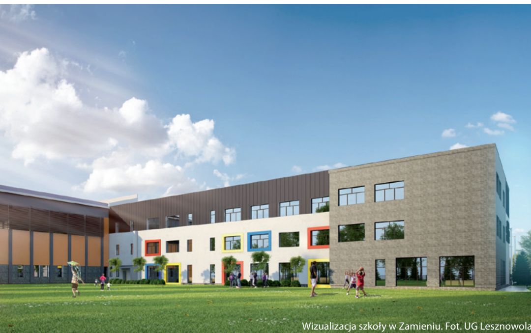
Wizualizacja szkoły w Zamieniu.