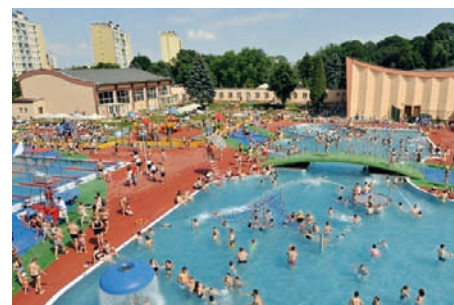
Otwarcie basenów.

Miasto Rzeszów inwestuje w infrastrukturę drogową, uzbraja tereny, w tym Specjalną Strefę Ekonomiczną „Rzeszów – Dworzysko”, stwarzające dogodne warunki do prowadzenia działalności gospodarczej. W strefie znajduje zatrudnienie kilka tysięcy pracowników, którzy w przeważającej większości zamieszkują dynamicznie powstające nowe osiedla. Statystyki pokazują, że 80 proc. mieszkańców nowych osiedli przeprowadziło się do Rzeszowa z innych gmin. Nowych mieszkańców do Rzeszowa często przyciąga oferta dydaktyczna przygotowana przez rzeszowskie uczelnie, które kształcą studentów, przyszłych pracowników wielu rzeszowskich przedsiębiorstw. Dodatkową zachętą do osiedlania się w Rzeszowie jest oferta rekreacyjno-kulturalna. Dzięki połączonym nakładom również infrastruktura sportowa jest systematycznie poszerzana. Przykładem jest budowa nowoczesnych basenów miejskich w kompleksie Rzeszowskiego Ośrodka Sportu i Rekreacji, które zostały oddane do użytku w czerwcu br.