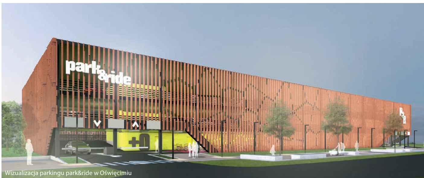
Wizualizacja parkingu park&ride w Oświęcimiu

Ciekawa, przyciągająca turystów oferta kulturalna i historyczna, wspieranie rozwoju lokalnych firm lub sprzedaż nieruchomości pod budownictwo – to sposoby, by zwiększyć wpływy do miejskiego budżetu. Trudno jednak myśleć o wydawaniu milionów bez środków zewnętrznych. Wysokie Mazowieckie stara się pozyskać dofinansowanie do 80 proc. swoich inwestycji, a Oświęcim dostaje dotacje do 50 proc. całkowitych kosztów swoich przedsięwzięć inwestycyjnych.