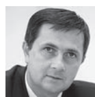
◀ Krzysztof Jażdżyk prezydent Skierniewic

Jestem przywiązany do tezy, że im więcej w mieście żurawi, dźwigów, ciągników, wykopów, im więcej ludzi na budowach, tym więcej pewności, że Konin zmierza w dobrym kierunku. Miasto jest dziś wielkim placem budowy. W latach 2015–2018 na zadania inwestycyjne przeznaczyliśmy 250 mln zł. Co najmniej dwa razy tyle zainwestowały spółki miejskie. Mieszkańcy Konina obserwują dziś rozbudowę skrzyżowania ulicy Warszawskiej z ulicą Kolską. Powstają dwa niezależne wiadukty, rondo turbinowe czterowłotowe, dodatkowe pasy ruchu, drogi rowerowe, chodniki, nowe oświetlenie uliczne, kanalizacja. Na północnym krańcu miasta zakończyliśmy budowę niezwykle ważnego łącznika ulic Kleczewskiej i Przemysłowej. Końca dobiega również projekt transportowy „Stworzenie zintegrowanego systemu komunikacji publicznej na terenie K OSI Miasta Konina” – budujemy ponad 8 km dróg rowerowych, kupiliśmy 8 autobusów, elektroniczne tablice przystankowe, uruchomiliśmy 11 stacji wypożyczalni rowerów miejskich (100 sztuk) oraz 8 punktów przesiadkowych typu bike&ride.