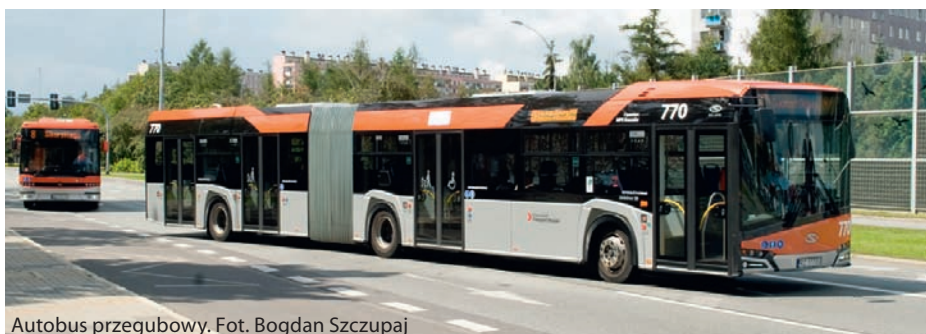
Autobus przegubowy.

Na tak pozytywne wyniki badań mają wpływ inwestycje realizowane na terenach przyłączonych. Budowa infrastruktury drogowej, szkół, przedszkoli, żłobków, domów kultury, lepsze skomunikowanie nowych terenów z centrum Rzeszowa dzięki nowoczesnym autobusom, sprawiają, że jakość życia mieszkańców zdecydowanie się poprawiła. Tylko na nowo przyłączonych osiedlach Rzeszowa zainwestowano już 2 miliardy złotych. ■