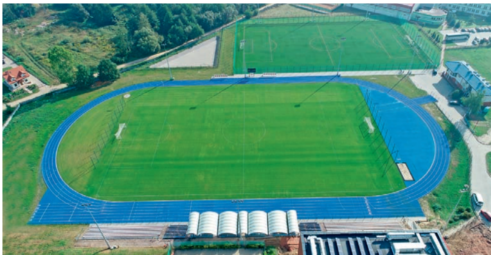
Stadion Nowiny.

To był intensywny czas dla samorządów wiejskich, który przyniósł ogromne korzyści gminom i jej mieszkańcom. Na niespotykaną dotąd skalę realizowano szereg inwestycji drogowych i proekologicznych, sięgnięto po ogromne dofinansowanie z zewnątrz. Wszystko to w oparciu o racjonalną gospodarkę finansową. Przed gminami wiejskimi jeszcze wiele wyzwań, ale wójtowie są przekonani, że zdołają je zrealizować.