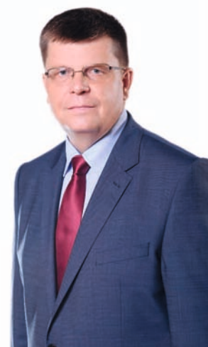
Jerzy Leszczyński marszałek woj. podlaskiego

Inwestycje to też wsparcie lokalnych samorządów w ich przedsięwzięciach infrastrukturalnych, takich jak drogi powiatowe czy lokalne lotniska w Białymstoku i Suwałkach. To ważne, bo działania każdego samorządu składają się na siłę całego regionu. Nam udało się dotychczas współpracować i inwestować tak, że jesteśmy jednym z proinwestycyjnych liderów, a przy tym najmniej zadłużonym województwem (ok. 30 mln zł), przy nominalnie najniższych dochodach własnych wśród województw!