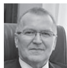
◀ Józef Nowicki prezydent Konina

Skierniewice Miastem Mieszkańców – ta idea przyświeca samorządowcom kreującym inwestycyjny obraz miasta. W ostatnich latach Skierniewice przekształciły się w miasto dobrze skomunikowane, z komfortową i bezpieczną przestrzenią do życia. Nowoczesny żłobek, budynek rehabilitacji zawodowej i społecznej osób niepełnosprawnych, zrewitalizowany zalew Zadębie, pierwsze w mieście muzeum czy wreszcie budowa domu pomocy społecznej – to flagowe inwestycje ostatnich lat. Miasto realizuje wielkie projekty, ale nie zapomina też o drobnych rozwiązaniach, które ułatwiają codzienne życie. Na uwagę zasługują remonty dróg i chodników. Prężnie działają lokalne spółki – jedna jest w trakcie realizowania ogromnego zadania związanego z uporządkowaniem gospodarki wodnościekowej. Trzeci kwartał 2018 roku to także duża komunikacyjna inwestycja polegająca na zakupie autobusów. Do końca roku na ulicach pojawi się 10 nowych pojazdów. ■