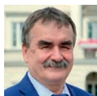
◀ Wojciech Lubawski prezydent Kielc