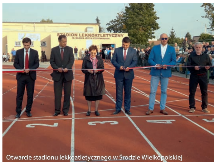
Otwarcie stadionu lekkoatletycznego w Środzie Wielkopolskiej