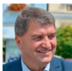
◀ Janusz Chwierut burmistrz Oświęcimia