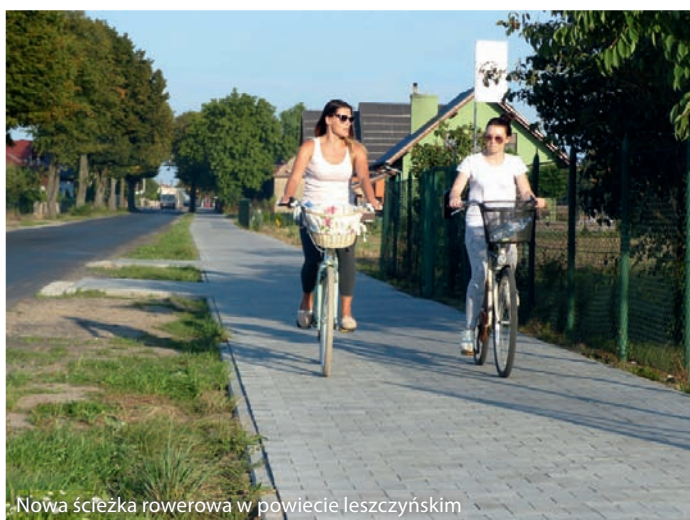
Nowa ścieżka rowerowa w powiecie leszczyńskim

Powiat leszczyński w naszym rankingu wskoczył z miejsca 34. na 5. „Przy