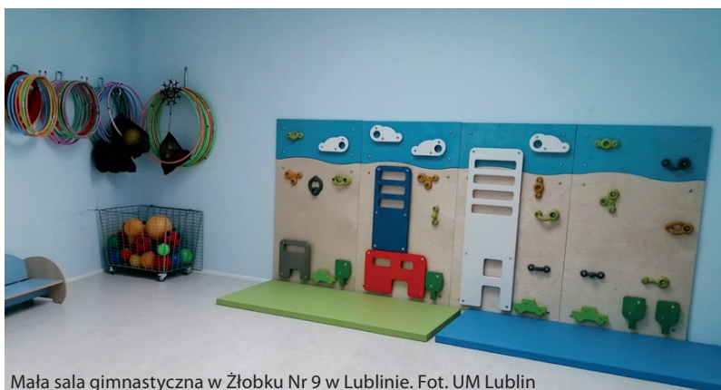
Mała sala gimnastyczna w Żłobku Nr 9 w Lublinie.