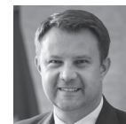
◀ Arkadiusz Wiśniewski prezydent Opola

mieszczeń dużej ilości naturalnego światła. Efekt ten uzyskano montując wielkopowierzchniowe okna, instalując dużą ilość okien dachowych, tzw. świetlików oraz urządzając na piętrze przeszkloną werandę. Obok żłobka znajduje się okazała i dobrze wyposażony plac zabaw, a od strony wejścia głównego jest parking na około 60 miejsc. Budynek jest energooszczędny. Na dachu zainstalowano ogniwa fotowoltaiczne (ponad 50 paneli) dostarczające rocznie ok. 21 tys. kW mocy oraz instalację solarną do podgrzewania wody użytkowej. Oprócz przestronnych bawialni i sypialni są dodatkowe sale, pełniące funkcję pomocniczą w opiece nad dziećmi z niepełnosprawnościami i trudnościami rozwojowymi. Przeznaczone są do indywidualnej pracy, a aranżacja przestrzeni i wyposażenie umożliwiają polisensoryczną stymulację zmysłów. Są to tzw. sale doświadczania świata („Leśna polana”, „Łąka”, „Kosmos”, „Ocean”), a także sala terapeutyczna, plastyczna, muzyczna i czytelnia „Biblioteczka misia”. Na piętrze ulokowane są również dwie sale gimnastyczne. ■