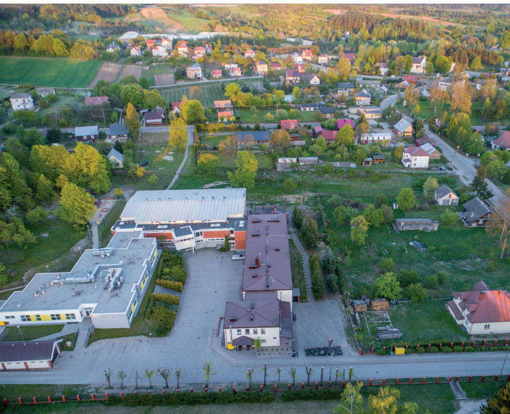
Na pierwszym planie budynek przedszkola z nowo otwartym żłobkiem w Mielniku.

Mielnik liczy około 2,2 tys. mieszkańców. Zrealizowany w 2018 roku program pn. „Radosne maluchy w żłobku w gminie Mielnik” zakładał uruchomienie gminnego żłobka z ośmioma miejscami opieki nad dziećmi do lat trzech. W ramach zadania o budżecie 300 tys. zł dofinansowanego z Europejskiego Funduszu Rozwoju Regionalnego (RPO Województwa Podlaskiego na lata 2014–2020) i rządowego programu Maluch+ udało się zakupić podstawowe wyposażenie, zatrudnić opiekunkę i zapewnić bieżące funkcjonowanie nowo utworzonych miejsc opieki.