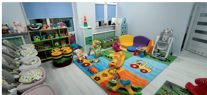
Jeden ze żłobków dotowanych przez gminę

pitą Opiekuńczy, a także tzw. świadczenia żłobkowego, tj. dofinansowania do opieki nad dziećmi do lat 3, gmina dodatkowo dotuje każde dziecko kwotą 500 zł miesięcznie, przy jednoczesnym wynegocjowaniu z właścicielami wszystkich niepublicznych żłobków opłaty miesięcznej w takiej samej wysokości.