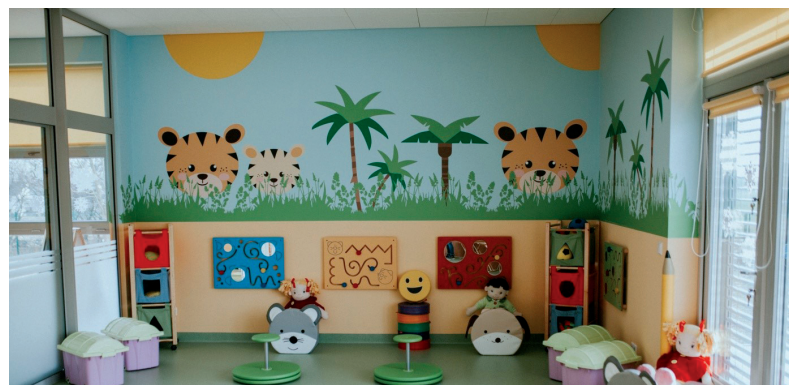
Żłobek Nr 3 w Opolu.

Coraz więcej młodych kobiet decyduje się na powrót do pracy zaraz po urlopie macierzyńskim. Samorządy, ale też rząd, muszą im to ułatwić. Jedynym rozwiązaniem jest tworzenie sieci żłobków, w których dzieci znajdują opiekę. Możliwości samorządów są ograniczone, jeśli chodzi o budowę nowych obiektów tego typu. Dlatego wypracowaliśmy w Opolu system dopłat do placówek prywatnych, z którego korzysta blisko 1400 dzieci. W sumie mamy 2104 miejsc w żłobkach. Chodzi o nich w tym roku ponad 1600 dzieci. To pokazuje, że w Opolu są dobre warunki dla młodych rodziców. Widząc, że dzieci przybywa, zdecydowaliśmy się na budowę dwóch przedszkoli. W jednym już dzieci się uczą, drugie będzie gotowe w przyszłym roku.