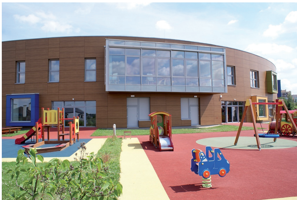
Żłobek Nr 9 w Lublinie.

Niewątpliwym atutem publicznej formy sprawowania opieki nad najmłodszymi jest wysokość kosztów ponoszonych przez rodziców. Utrzymanie opłat na niskim poziomie, a także system ulg i zwolnień tworzą korzystną ofertę dla rodziców. Zaletą są też preferencje w procedurze naboru do żłobków publicznych. Pierwszeństwo dla dzieci z niepełnosprawnościami czy z rodzin wielodzietnych daje rodzicom gwarancję, że dzieci zostaną przyjęte do miejskich placówek.