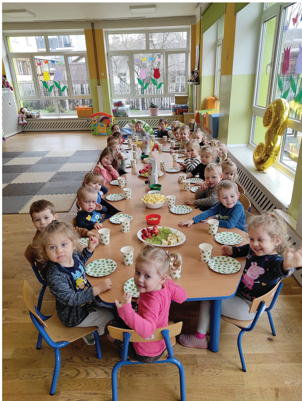
Na zdjęciach: żłobek miejski w Sejnach.

Nowy lider rankingu w tej kategorii – podlaskie Sejny – wykonał kawał dobrej roboty. W żłobkowym rankingu za 2016 rok miasto zajmowało bowiem dopiero 190. miejsce.