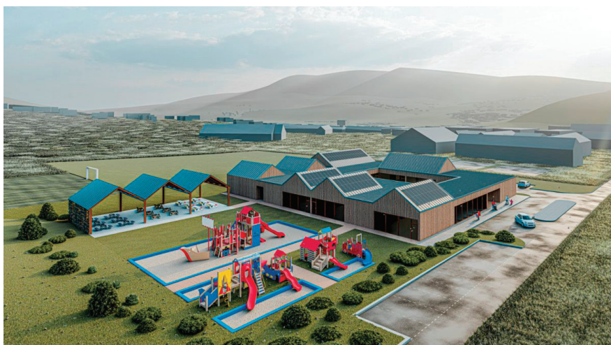
Wizualizacja przedszkola i żłobka w Mszanie Dolnej.