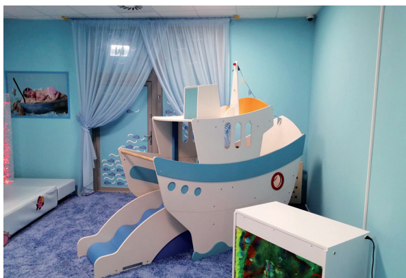
Sala Ocean w Żłobku Nr 9 w Lublinie.

dziecięcym). W ostatnich latach liczba niepublicznych placówek wzrosła z 14 w 2014 r. (283 miejsca) do 77 w roku 2022 (2460 miejsc).