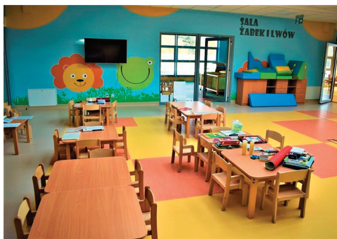
Żłobek miejski w Kostrzynie nad Odrą.