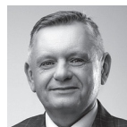
◀ Piotr Jedliński prezydent Koszalina