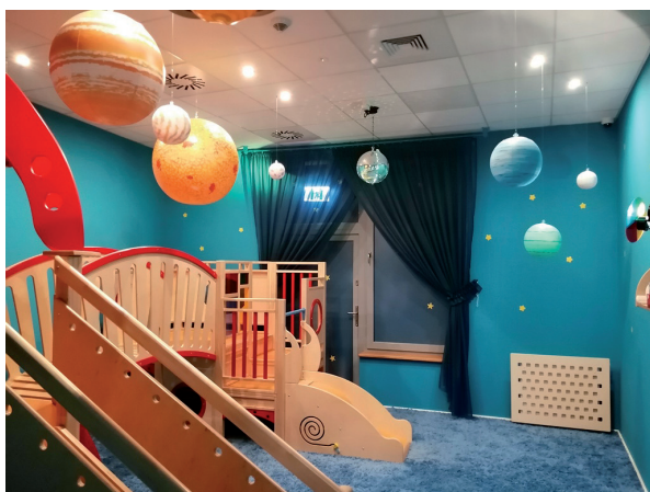
Sala Kosmos w Żłobku Nr 9 w Lublinie.